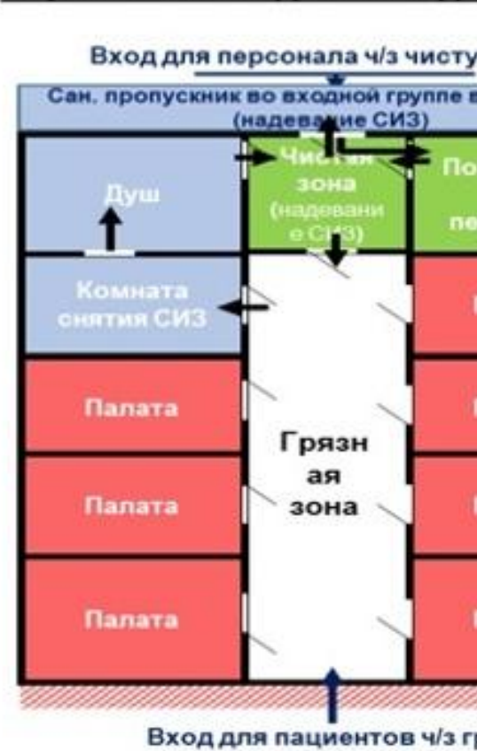
Схема модульного инфекционного стационара