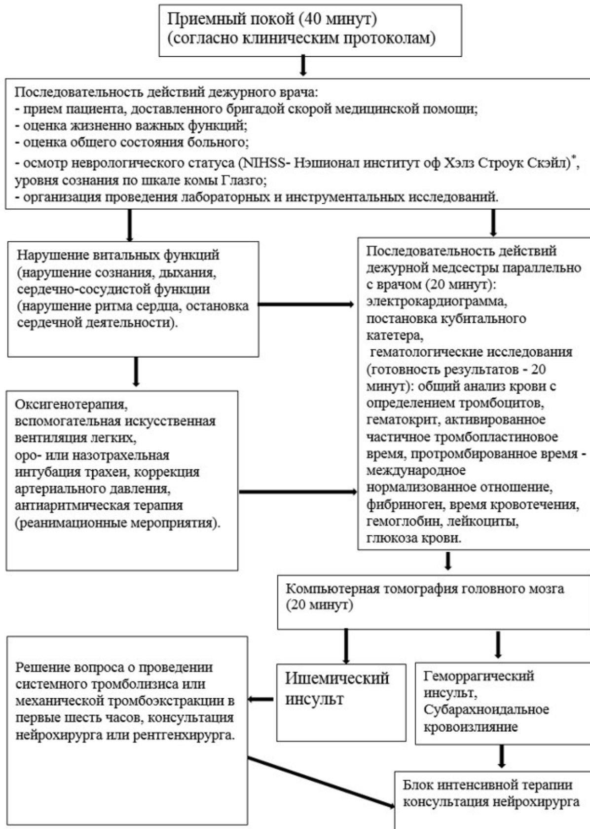
Алгоритм действий в блоке интенсивной терапии при геморрагическом инсульте (Внутри мозговое и (или) внутрижелудочковое кровоизлияние)